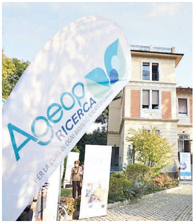
➔ Casa di accoglienza Siepelunga