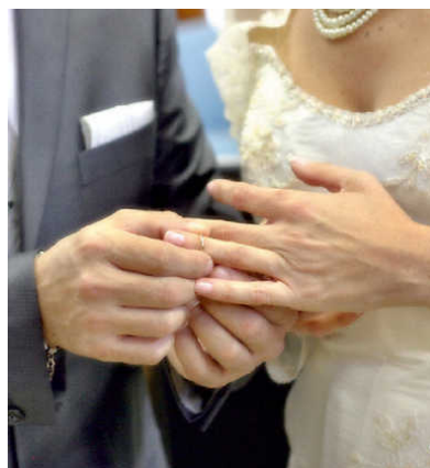
➔ Lo scambio delle fedeli nel matrimonio, ora ci sono anche corsi laici per arrivare all'altare

Oggi i corsi sono quasi tutti in chiave religiosa: «Noi - prosegue - vo-